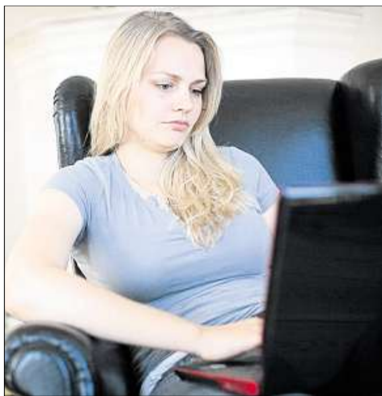
Suchen und finden: Wer mit seiner Anfrage schnell ans Ziel kommen will, muss eingrenzen und seine Eingabe eindeutig formulieren.

Suchmaschinen-Anbieter wie Google, Yahoo und Microsoft arbeiten zudem „indexbasiert“, erläutert Florian Koch vom IT-Brancheverband Bitkom in Berlin. Mit Hilfe automatischer Programme,